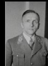
DR. GERHARD KLOPFER