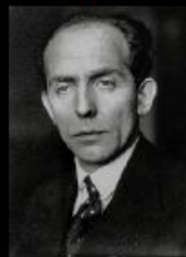
DR. ROLAND FREISLER