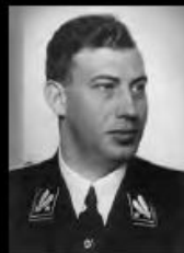
DR. WILHELM STUCKART