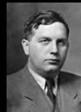
DR. JOSEF BÜHLER